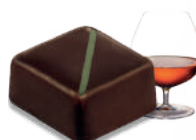
CARAMEL CALVADOS CARAMEL WITH CALVADOS