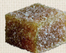
POMME - CANNELLE APPLE - CINNAMON