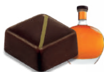
CARAMEL COGNAC CARAMEL WITH COGNAC