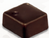
GANACHE RÉPUBLIQUE DOMINICAINE DOMINICAN REPUBLIC GANACHE