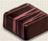
CARAMEL FRAMBOISE RASPBERRY CARAMEL