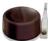
CARAMEL KIRSCH CARAMEL WITH KIRSCH