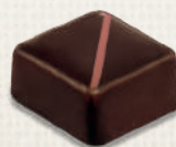
GANACHE CERISE CHERRY GANACHE