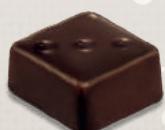
GANACHE TANZANIE TANZANIA GANACHE