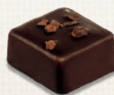
GANACHE CHOCOLAT CHOCOLATE GANACHE