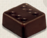
GANACHE HAÏTI HAITI GANACHE