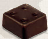
GANACHE ÉQUATEUR ECUADOR GANACHE