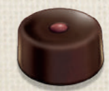
GANACHE PORTO-PRUNEAUX PORT WINE AND PRUNES GANACHE