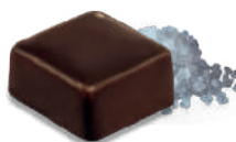
FLEUR DE SEL SEA SALT