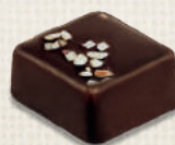
PRALINÉ NOISETTE HAZELNUT PRALINE