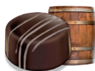
GANACHE RHUM RUM GANACHE