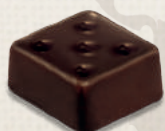
GANACHE MADAGASCAR MADAGASCAR GANACHE