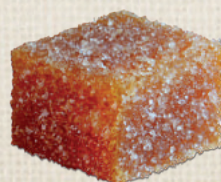
PASSION PASSION FRUIT