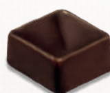
GANACHE FLEUR DE SEL SEA SALT GANACHE