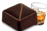
CARAMEL WHISKY CARAMEL WITH WHISKY