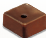
PRALINÉ AMANDE-PISTACHE PISTACHIO AND ALMOND PRALINE

Assortiment sélectionné par nos maîtres chocolatiers Assortment selected by our master chocolatiers