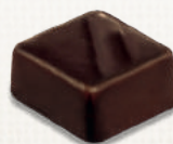
PRALINÉ NOISETTE FLEUR DE SEL HAZELNUT PRALINE WITH SEA SALT