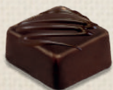
GANACHE CAFÉ ÉQUATEUR ECUADOR COFFEE GANACHE